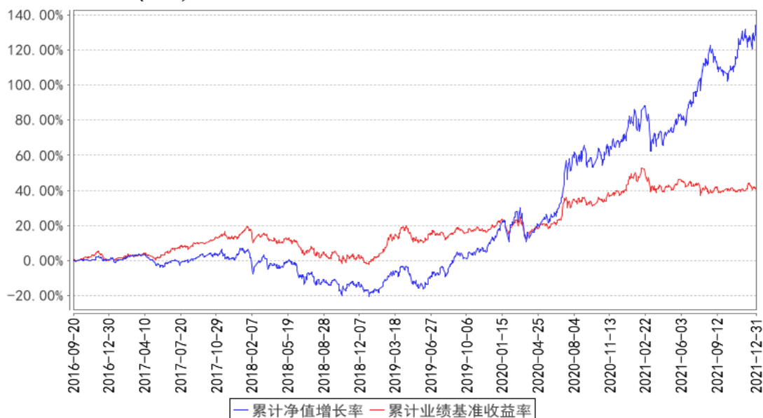
鹏华增瑞混合（LOF）累计净值增长率与同期业绩比较基准收益率的历史走势对比图

注：1、本基金基金合同于 2016 年 09 月 20 日生效。2、截至建仓期结束，本基金的各项投资比例已达到基金合同中规定的各项比例。