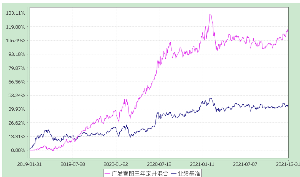
广发睿阳三年定期开放混合型证券投资基金 份额累计净值增长率与业绩比较基准收益率的历史走势对比图 (2019 年 1 月 31 日至 2021 年 12 月 31 日)