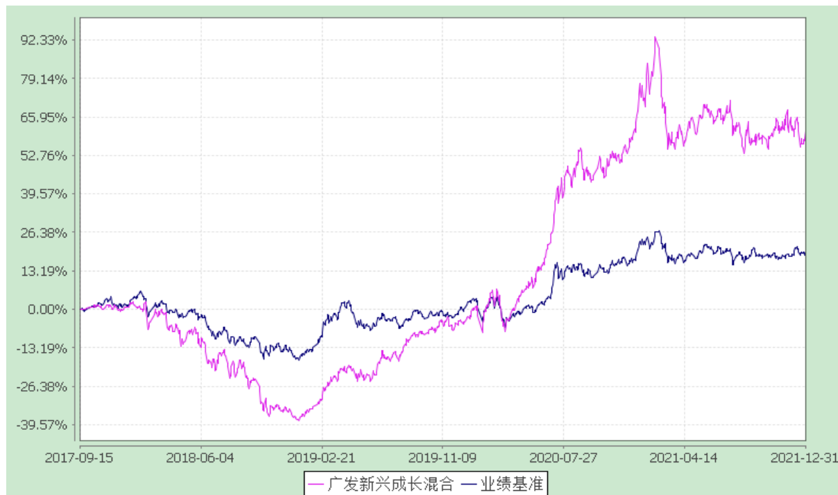
广发新兴成长灵活配置混合型证券投资基金 份额累计净值增长率与业绩比较基准收益率的历史走势对比图 (2017 年 9 月 15 日至 2021 年 12 月 31 日)