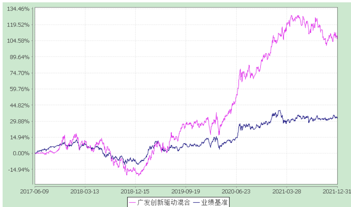
广发创新驱动灵活配置混合型证券投资基金 份额累计净值增长率与业绩比较基准收益率的历史走势对比图 (2017年6月9日至2021年12月31日)