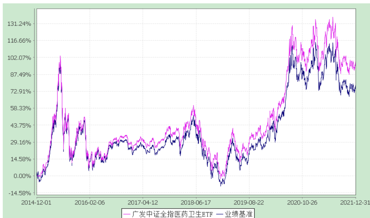
广发中证全指医药卫生交易型开放式指数证券投资基金 份额累计净值增长率与业绩比较基准收益率的历史走势对比图 (2014 年 12 月 1 日至 2021 年 12 月 31 日)