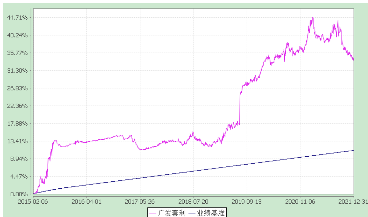
广发对冲套利定期开放混合型发起式证券投资基金 份额累计净值增长率与业绩比较基准收益率的历史走势对比图 (2015年2月6日至2021年12月31日)