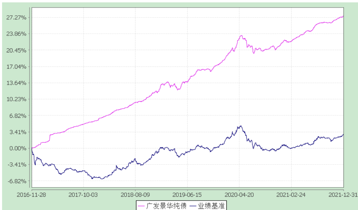
份额累计净值增长率与业绩比较基准收益率的历史走势对比图 (2016 年 11 月 28 日至 2021 年 12 月 31 日)