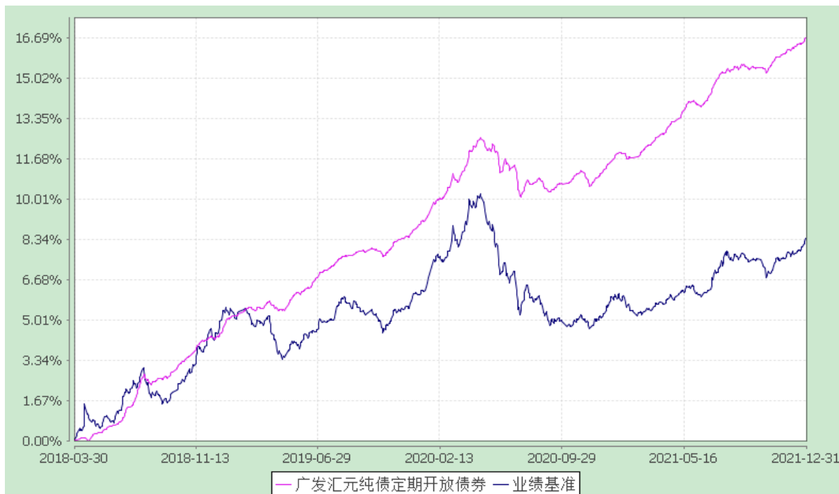
份额累计净值增长率与业绩比较基准收益率的历史走势对比图 (2018 年 3 月 30 日至 2021 年 12 月 31 日)