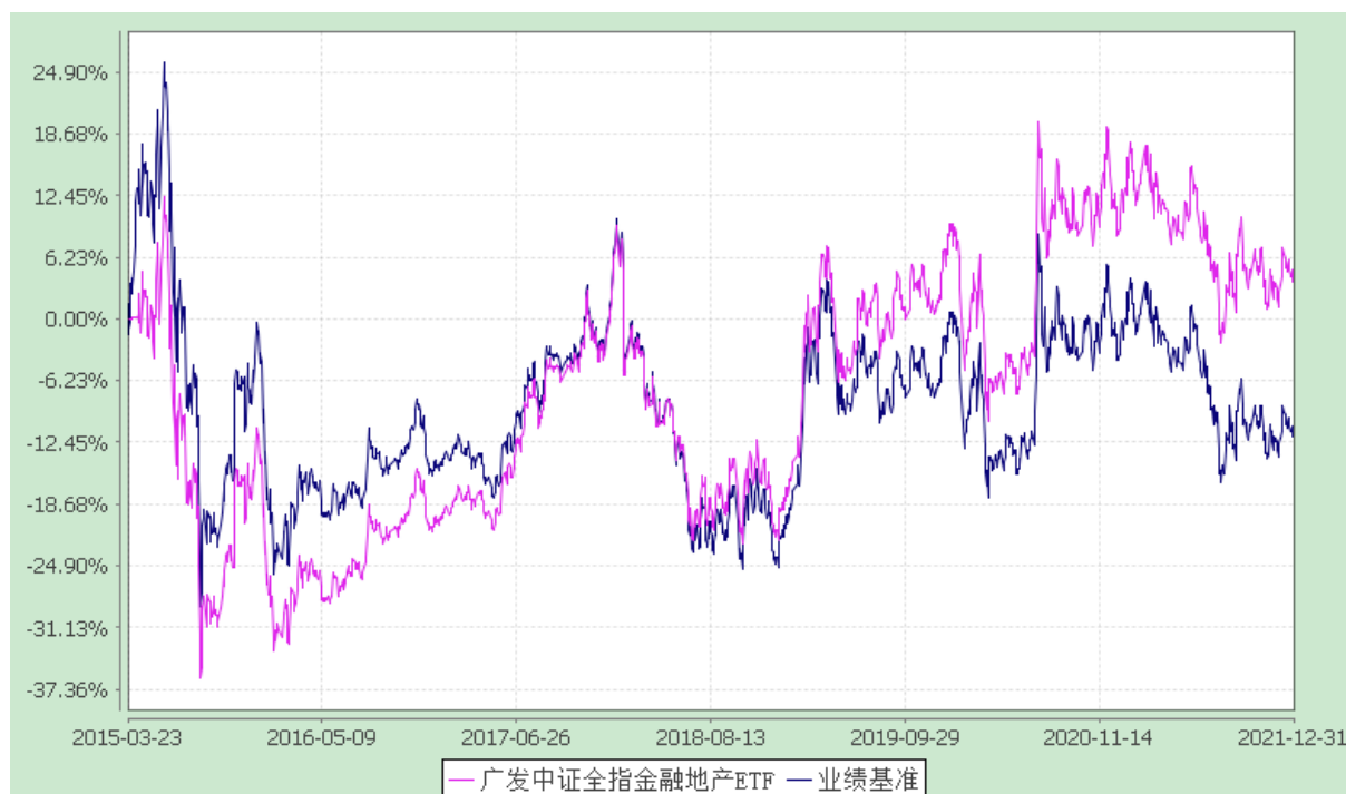
广发中证全指金融地产交易型开放式指数证券投资基金 份额累计净值增长率与业绩比较基准收益率的历史走势对比图 (2015 年 3 月 23 日至 2021 年 12 月 31 日)