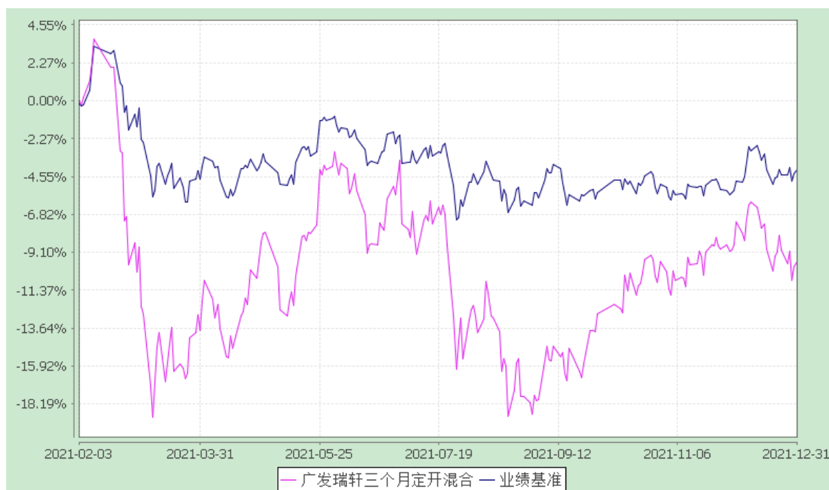
广发瑞轩三个月定期开放混合型发起式证券投资基金 份额累计净值增长率与业绩比较基准收益率的历史走势对比图 (2021年2月3日至2021年12月31日)