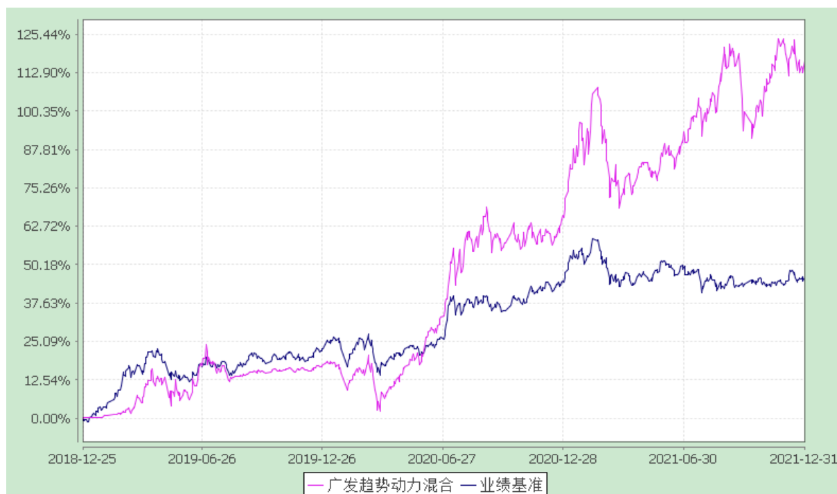
广发趋势动力灵活配置混合型证券投资基金 份额累计净值增长率与业绩比较基准收益率的历史走势对比图 (2018 年 12 月 25 日至 2021 年 12 月 31 日)