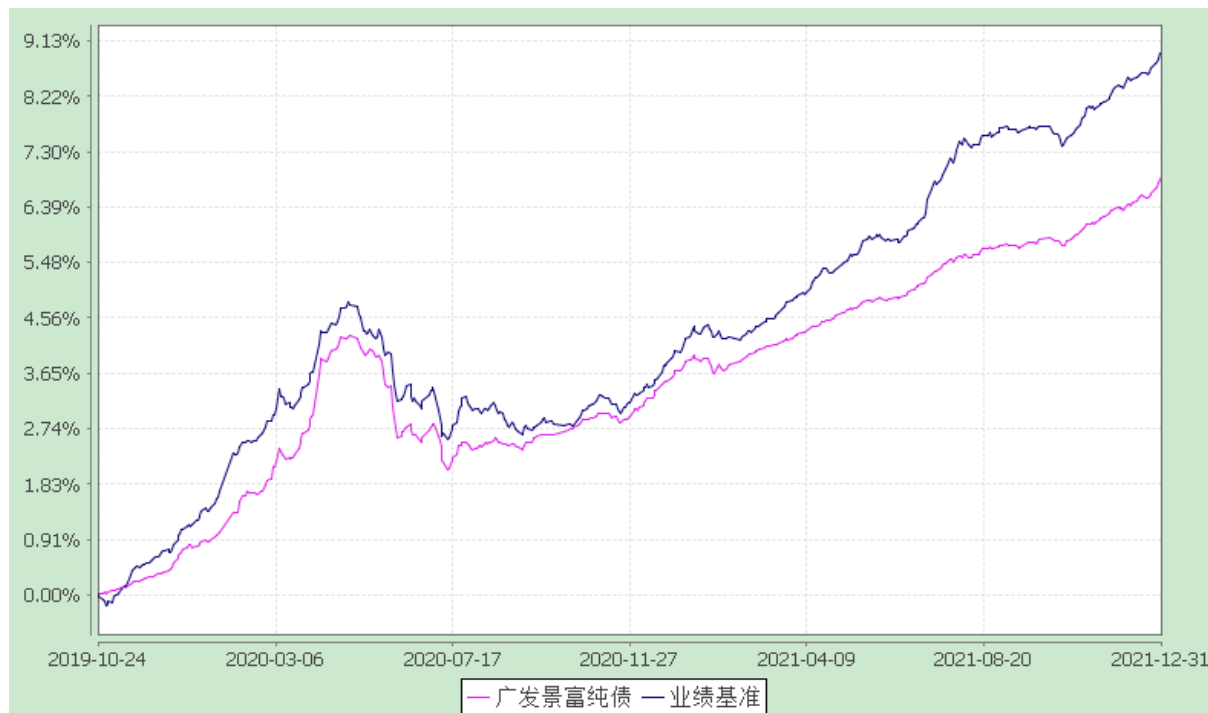
广发景富纯债债券型证券投资基金 份额累计净值增长率与业绩比较基准收益率的历史走势对比图 (2019 年 10 月 24 日至 2021 年 12 月 31 日)