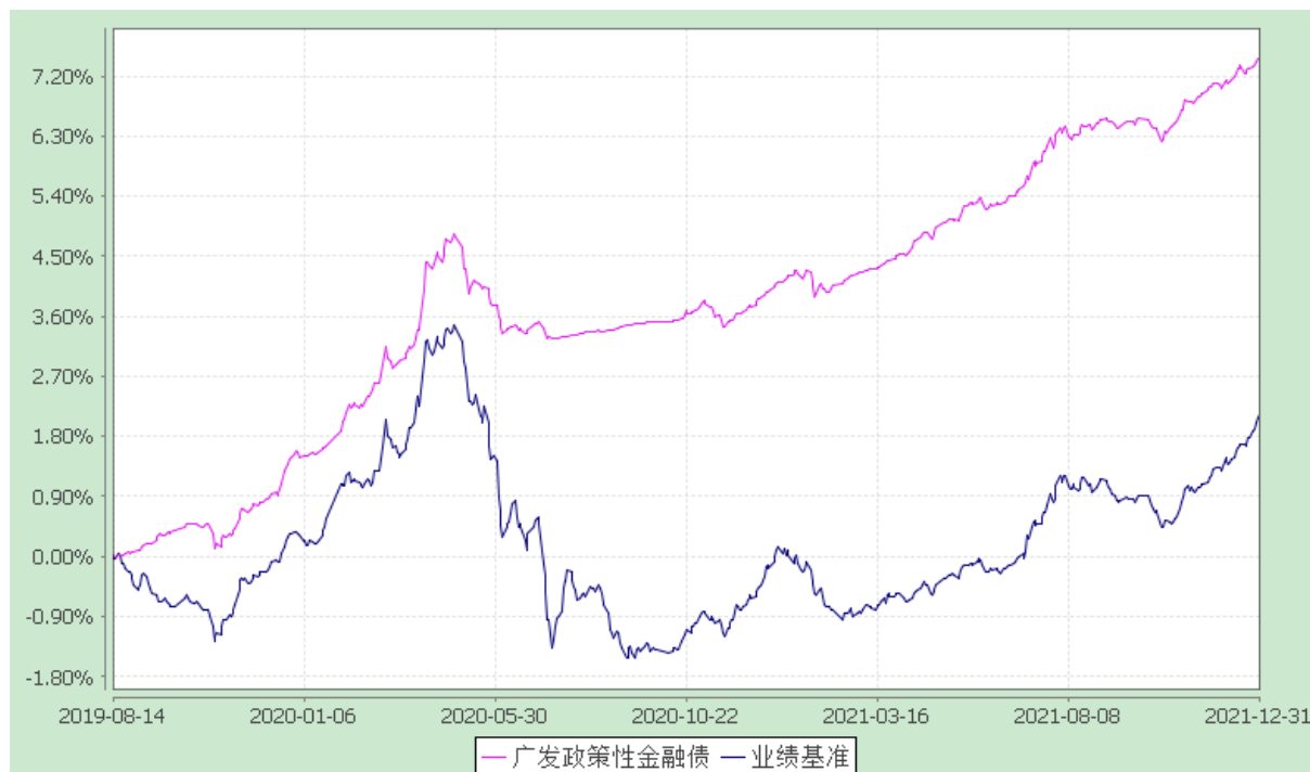
份额累计净值增长率与业绩比较基准收益率的历史走势对比图 (2019 年 8 月 14 日至 2021 年 12 月 31 日)