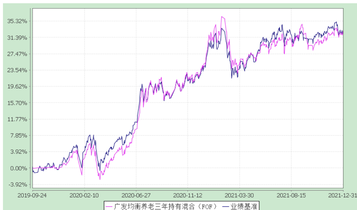
广发均衡养老目标三年持有期混合型基金中基金（FOF） 份额累计净值增长率与业绩比较基准收益率历史走势对比图 （2019 年 9 月 24 日至 2021 年 12 月 31 日）