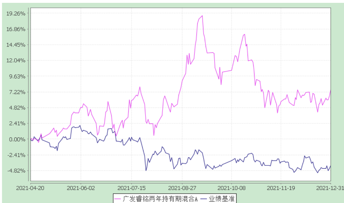
广发睿铭两年持有期混合 C