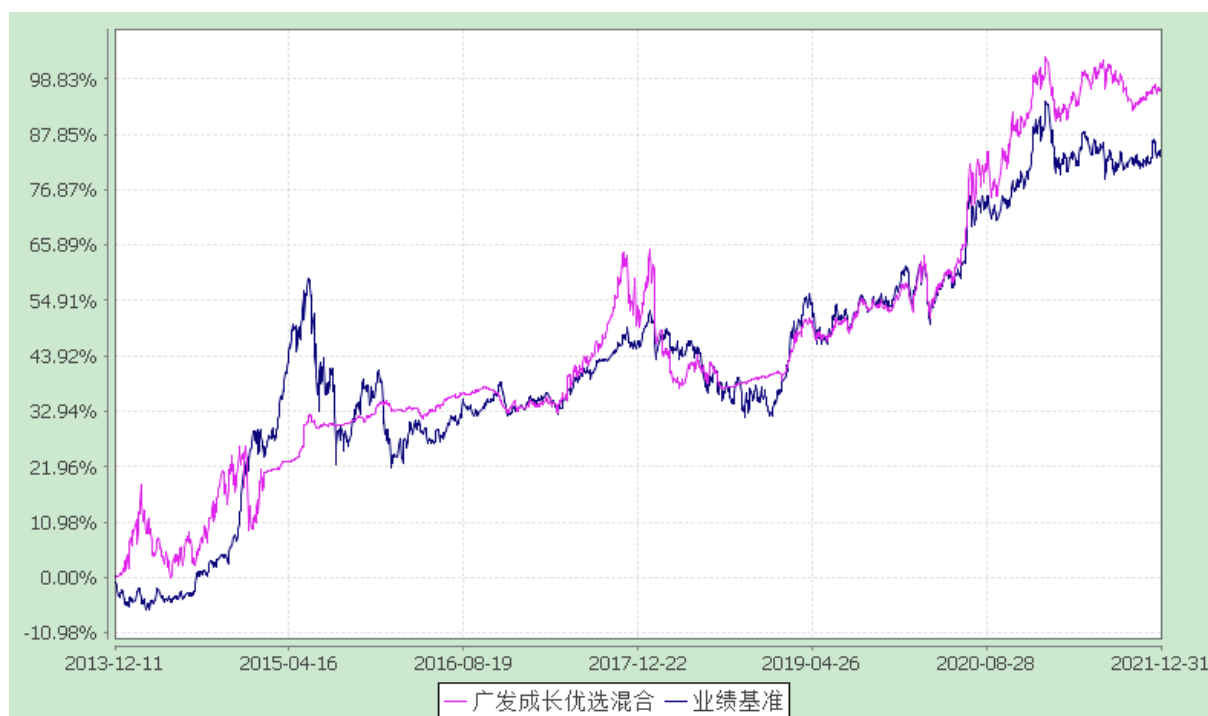
广发成长优选灵活配置混合型证券投资基金 份额累计净值增长率与业绩比较基准收益率的历史走势对比图 (2013 年 12 月 11 日至 2021 年 12 月 31 日)