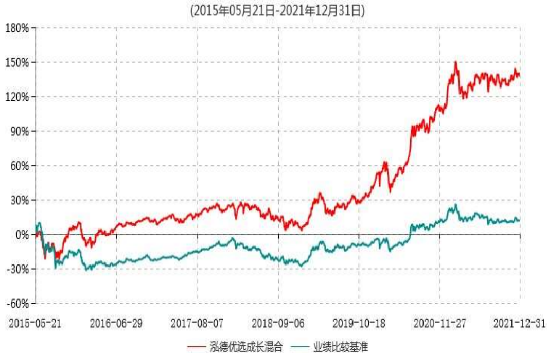
泓德优选成长混合型证券投资基金累计净值增长率与业绩比较基准收益率历史走势对比图

注：根据基金合同的约定，本基金建仓期为6个月，截至报告期末，本基金的各项投资比例符合基金合同关于投资范围及投资限制规定。