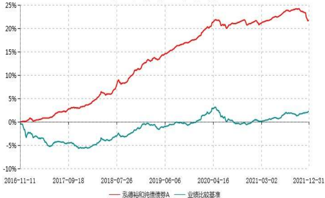
泓德裕和纯债债券A累计净值增长率与业绩比较基准收益率历史走势对比图 (2016年11月11日-2021年12月31日)