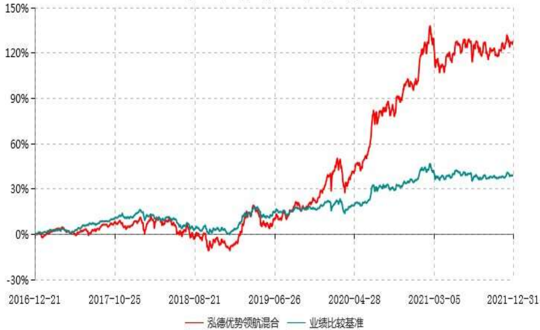
泓德优势领航灵活配置混合型证券投资基金累计净值增长率与业绩比较基准收益率历史走势对比图 (2016年12月21日-2021年12月31日)

注：根据基金合同的约定，本基金建仓期为6个月，截至报告期末，本基金的各项投资比例符合基金合同关于投资范围及投资限制规定。