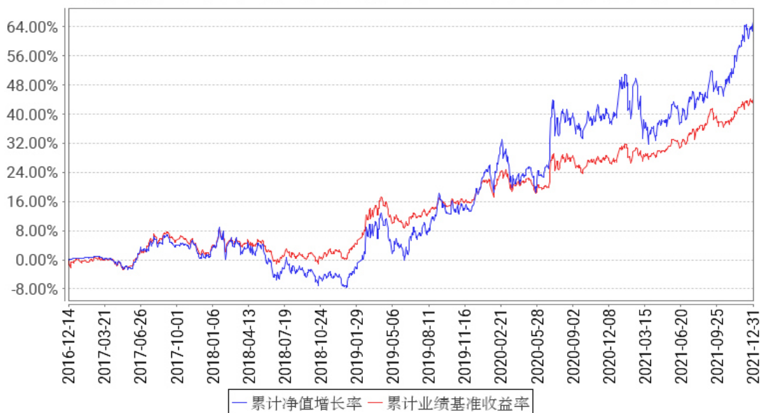
工银可转债债券累计净值增长率与同期业绩比较基准收益率的历史走势对比图