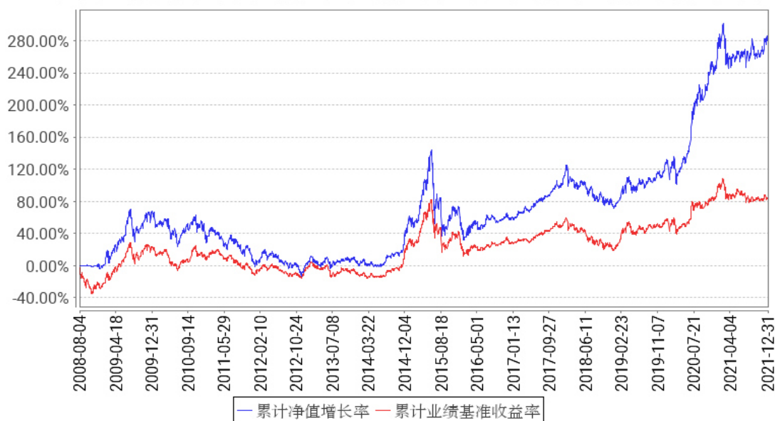
工银大盘蓝筹混合累计净值增长率与同期业绩比较基准收益率的历史走势对比图