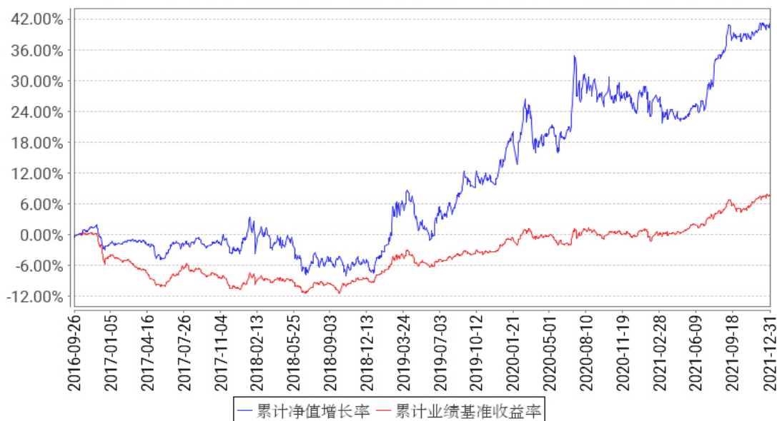
工银双债LOF累计净值增长率与同期业绩比较基准收益率的历史走势对比图

注：1、本基金于2016年9月26日由“工银瑞信双债增强债券型证券投资基金”转型而来。