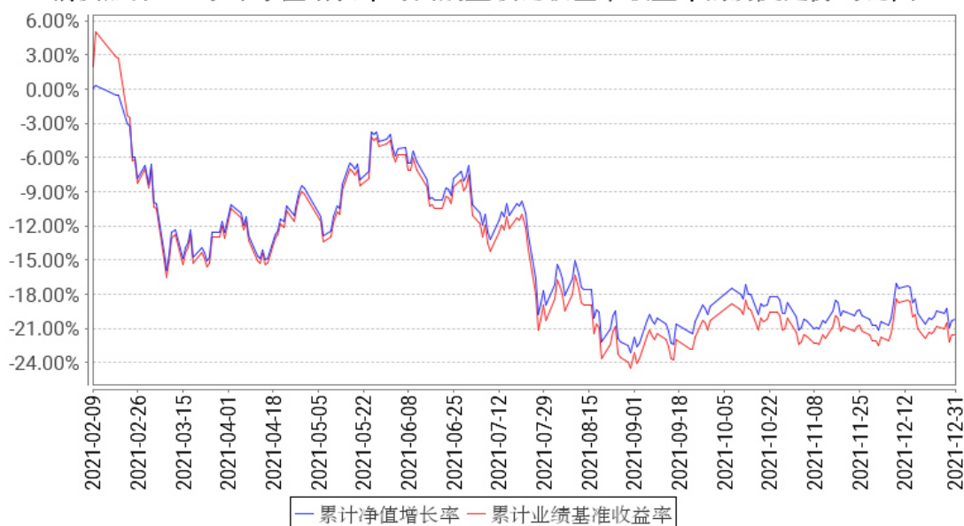
消费服务ETF累计净值增长率与同期业绩比较基准收益率的历史走势对比图

注：1、本基金基金合同于 2021 年 02 月 09 日生效。截至报告期末，本基金基金合同生效未满 1 年。