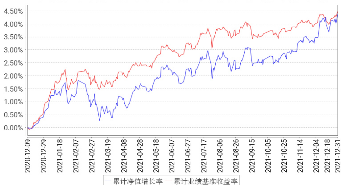
工银双盈债券A累计净值增长率与同期业绩比较基准收益率的历史走势对比图