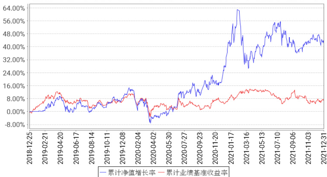
工银红利优享混合A累计净值增长率与同期业绩比较基准收益率的历史走势对比图