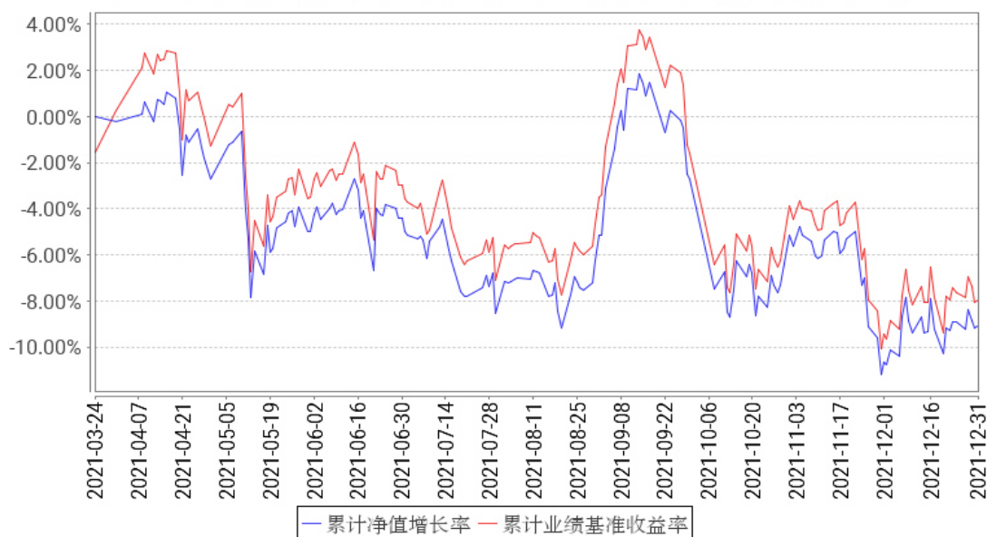
日经ETF累计净值增长率与同期业绩比较基准收益率的历史走势对比图

注：1、本基金基金合同于 2021 年 03 月 24 日生效。截至报告期末，本基金基金合同生效未满 1 年。