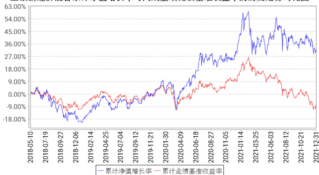
工银新经济混合累计净值增长率与同期业绩比较基准收益率的历史走势对比图