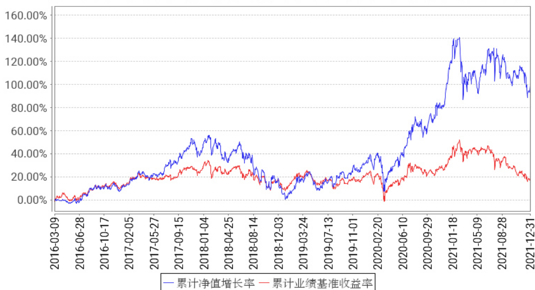
工银香港中小盘累计净值增长率与同期业绩比较基准收益率的历史走势对比图