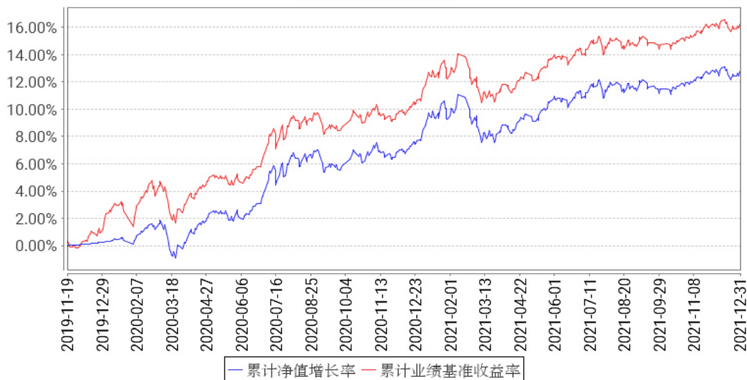
工银智远配置三个月持有期混合FOF累计净值增长率与同期业绩比较基准收益率的历史走势对比图