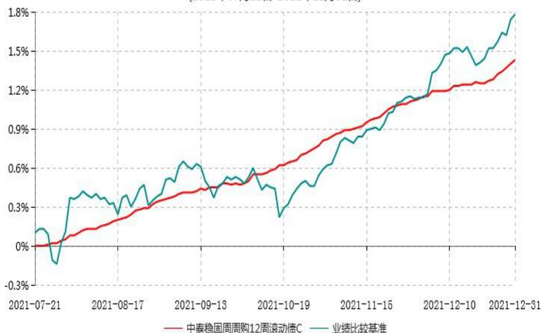
中泰稳固周周购12周滚动债C累计净值增长率与业绩比较基准收益率历史走势对比图 (2021年07月21日-2021年12月31日)