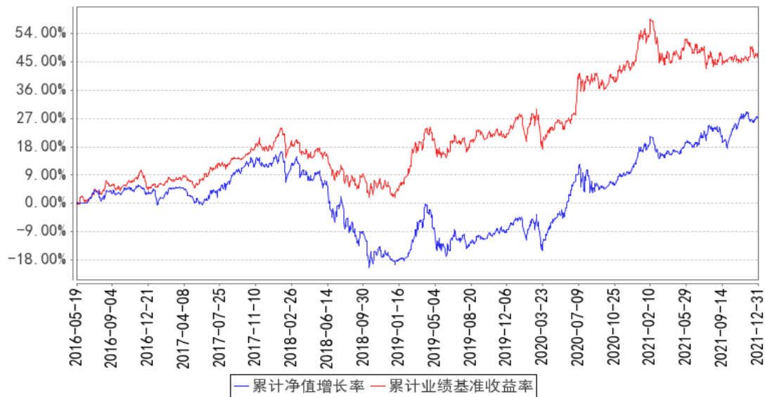
民生加银量化中国混合累计净值增长率与同期业绩比较基准收益率的历史走势对比图

注：本基金合同于 2016 年 5 月 19 日生效，本基金建仓期为自基金合同生效日起的 6 个月。截至建仓期结束及本报告期末，本基金各项资产配置比例符合基金合同及招募说明书有关投资比例的约定。