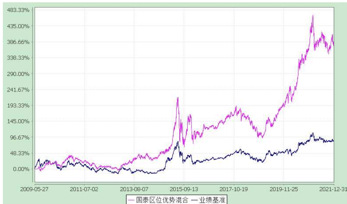
自基金合同生效以来份额累计净值增长率与业绩比较基准收益率的历史走势对比图 (2009 年 5 月 27 日至 2021 年 12 月 31 日)

注：本基金合同生效日为 2009 年 5 月 27 日。本基金在六个月建仓期结束时，各项资产配置比例符合合同约定。