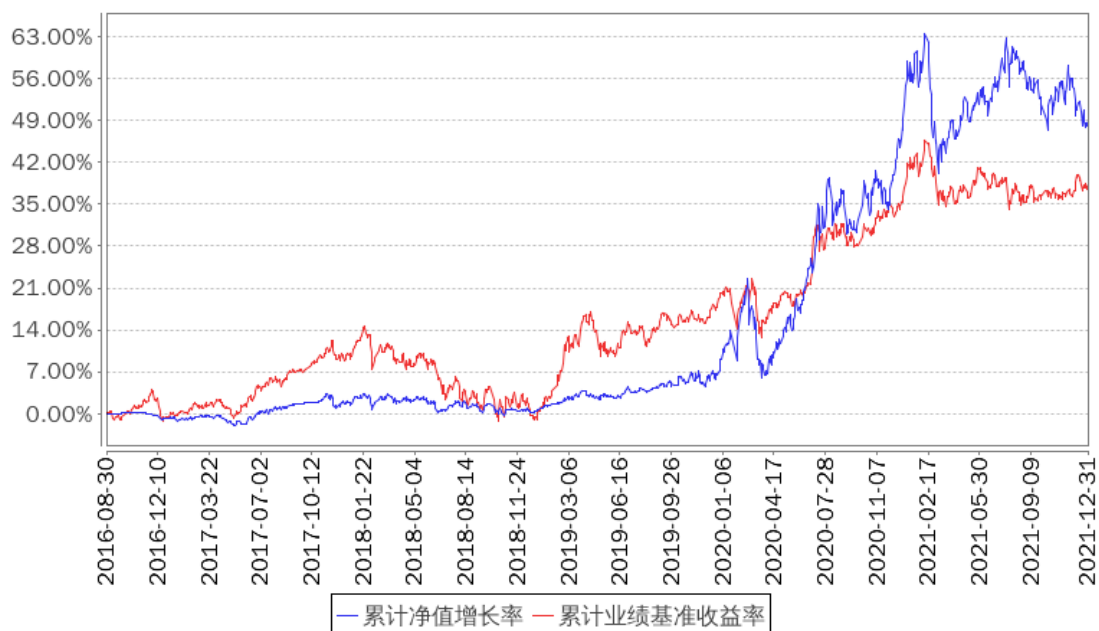
招商睿祥定开混合累计净值增长率与同期业绩比较基准收益率的历史走势对比图