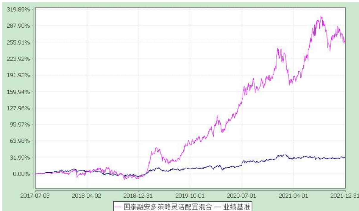
自基金合同生效以来份额累计净值增长率与业绩比较基准收益率的历史走势对比图 (2017 年 7 月 3 日至 2021 年 12 月 31 日)

注：本基金合同生效日为 2017 年 7 月 3 日。本基金在六个月建仓期结束时，各项资产配置比例符合合同约定。