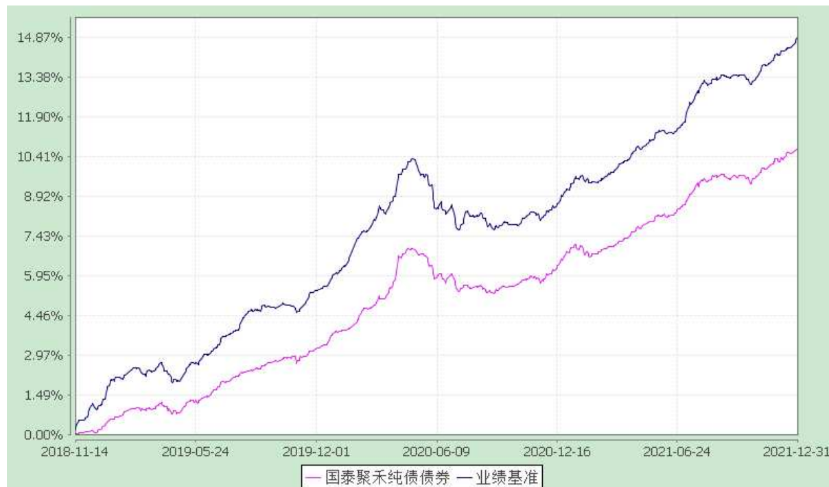
自基金合同生效以来份额累计净值增长率与业绩比较基准收益率的历史走势对比图 (2018 年 11 月 14 日至 2021 年 12 月 31 日)

注：本基金合同生效日为 2018 年 11 月 14 日，本基金在六个月建仓期结束时，各项资产配置比例符合合同约定。