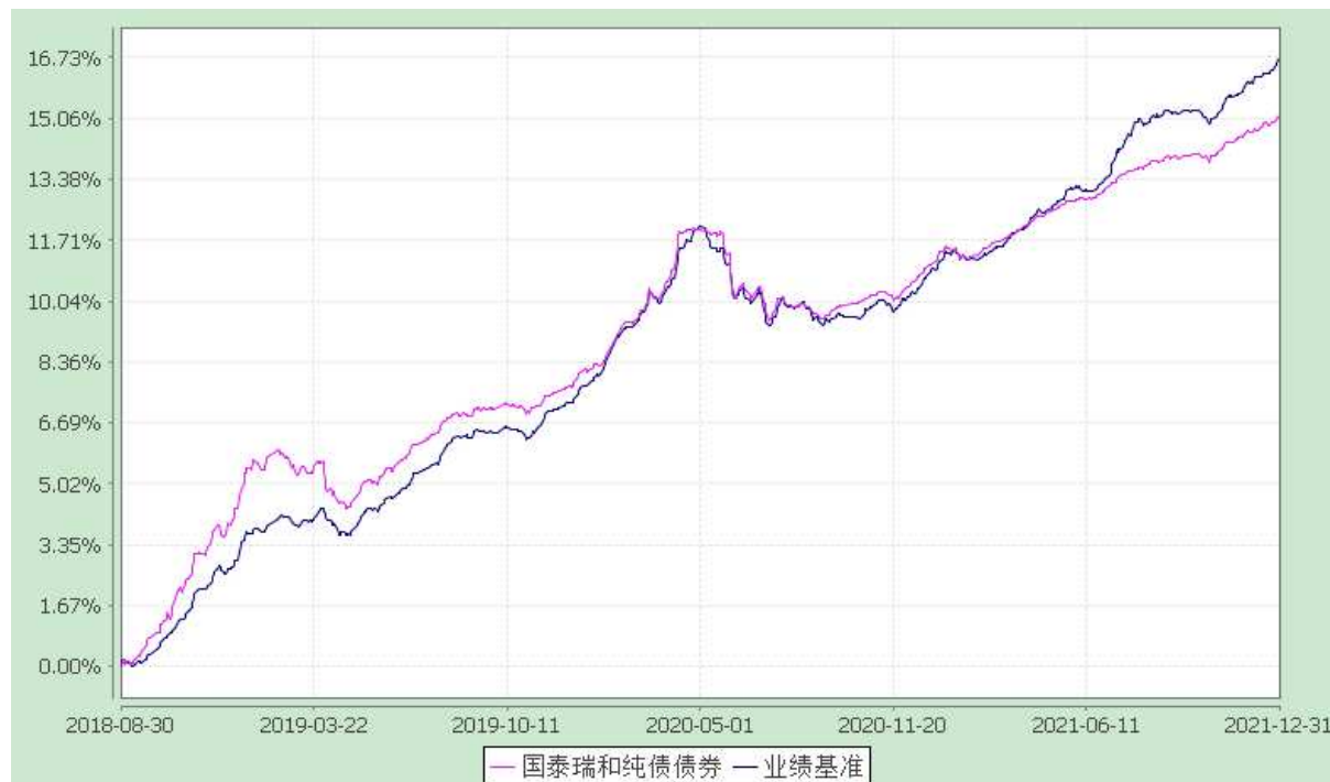
自基金合同生效以来份额累计净值增长率与业绩比较基准收益率的历史走势对比图 (2018 年 8 月 30 日至 2021 年 12 月 31 日)

注：本基金合同生效日为 2018 年 8 月 30 日，在 6 个月建仓期结束时，各项资产配置比例符合合同约定。