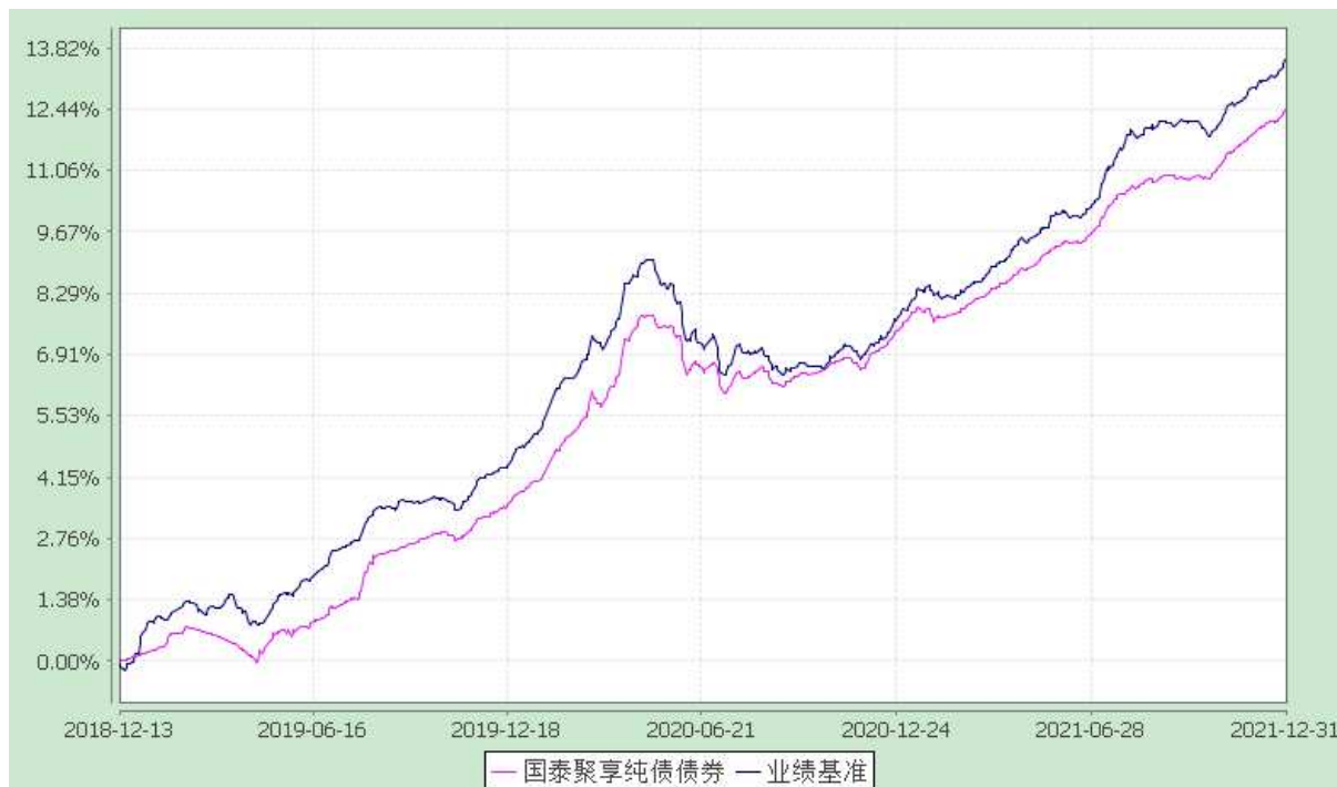
自基金合同生效以来份额累计净值增长率与业绩比较基准收益率的历史走势对比图 (2018 年 12 月 13 日至 2021 年 12 月 31 日)

注：本基金合同生效日为 2018 年 12 月 13 日。本基金在六个月建仓期结束时，各项资产配置比例符合合同约定。