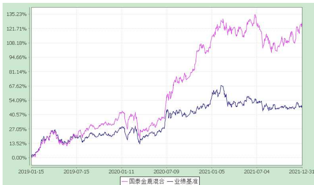
自基金转型以来份额累计净值增长率与业绩比较基准收益率的历史走势对比图 (2019 年 1 月 15 日至 2021 年 12 月 31 日)

注：本基金合同生效日为 2019 年 1 月 15 日。本基金在六个月建仓期结束时，各项资产配置比例符合合同约定。