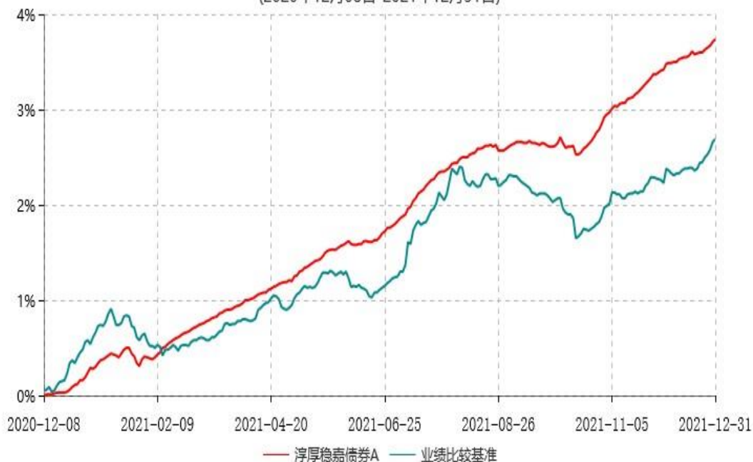
淳厚稳嘉债券A累计净值增长率与业绩比较基准收益率历史走势对比图 (2020年12月08日-2021年12月31日)

注：本基金基金合同生效日为2020年12月8日。按基金合同规定，本基金自基金合同生效起6个月内为建仓期。建仓期结束时本基金的各项投资比例均符合基金合同约定。