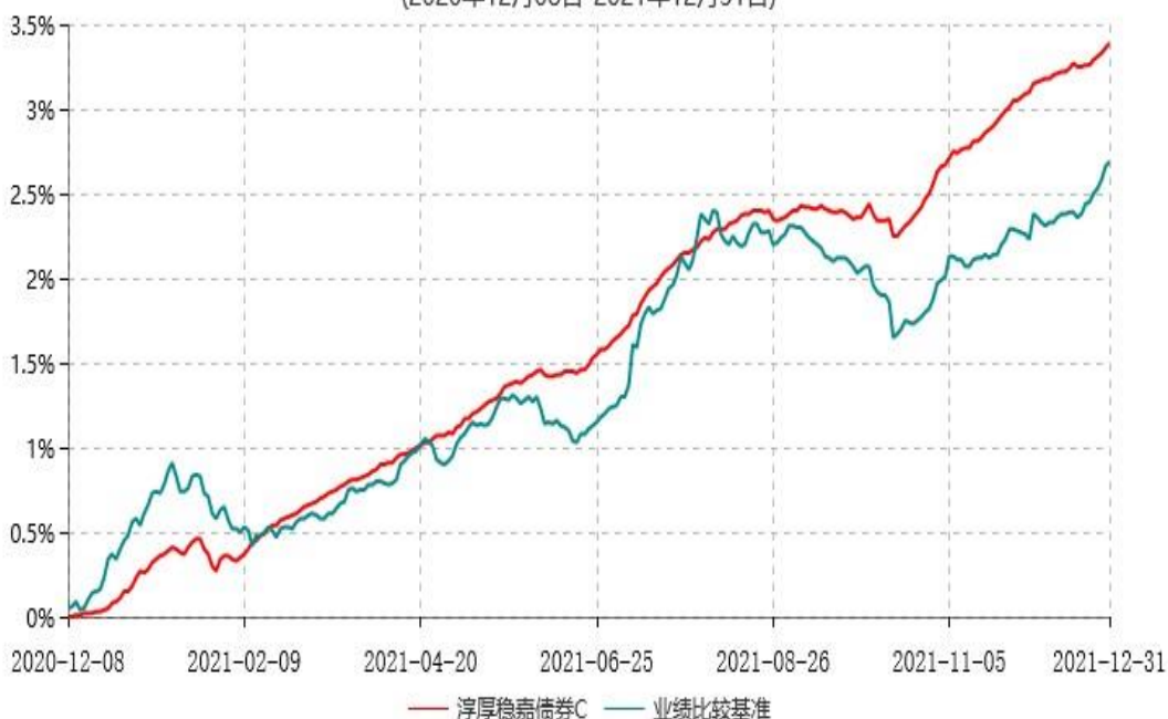
淳厚稳嘉债券C累计净值增长率与业绩比较基准收益率历史走势对比图 (2020年12月08日-2021年12月31日)

注：本基金基金合同生效日为2020年12月8日。按基金合同规定，本基金自基金合同生效起6个月内为建仓期。建仓期结束时本基金的各项投资比例均符合基金合同约定。