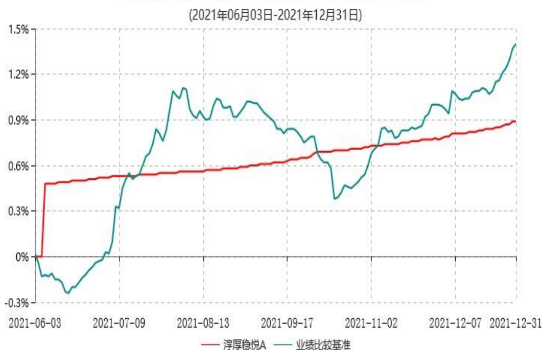
淳厚稳悦A累计净值增长率与业绩比较基准收益率历史走势对比图

注：本基金基金合同生效日为 2021 年 06 月 03 日，至报告期末未满足 1 年。按基金合同规定，本基金自基金合同生效起 6 个月内为建仓期。建仓期结束时本基金的各项投资比例均符合基金合同约定。