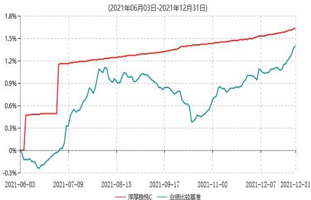
淳厚稳悦C累计净值增长率与业绩比较基准收益率历史走势对比图

注：本基金基金合同生效日为 2021 年 06 月 03 日，至报告期末未满足 1 年。按基金合同规定，本基金自基金合同生效起 6 个月内为建仓期。建仓期结束时本基金的各项投资比例均符合基金合同约定。