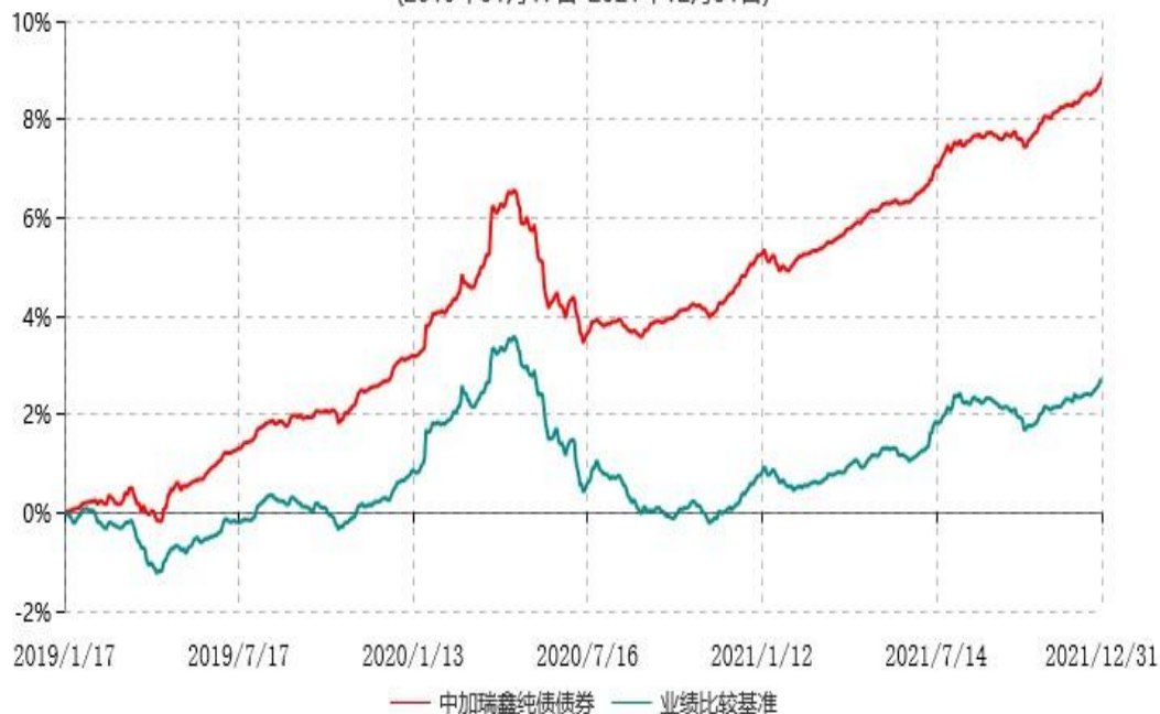
中加瑞鑫纯债债券型证券投资基金累计净值增长率与业绩比较基准收益率历史走势对比图 (2019年01月17日-2021年12月31日)