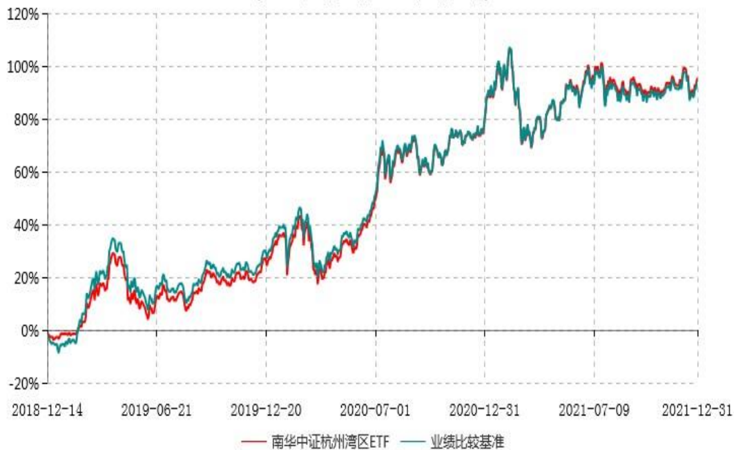
南华中证杭州湾区交易型开放式指数证券投资基金累计净值增长率与业绩比较基准收益率历史走势对比图 (2018年12月14日-2021年12月31日)