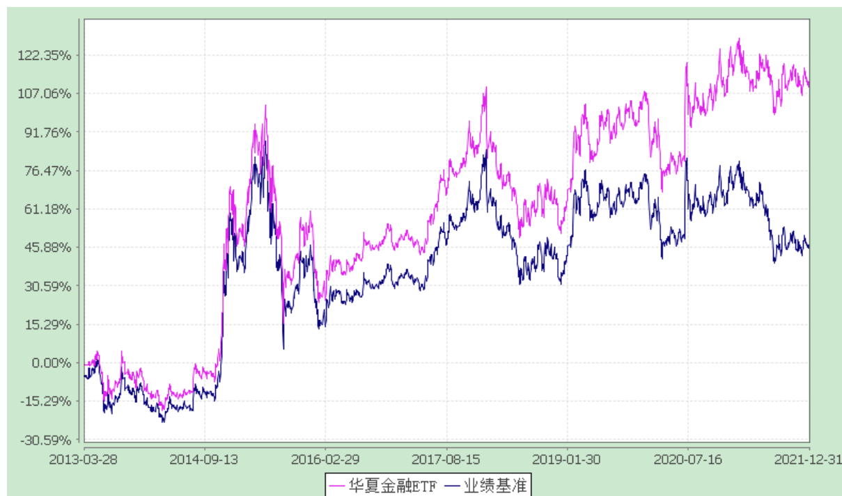
上证金融地产交易型开放式指数发起式证券投资基金 份额累计净值增长率与业绩比较基准收益率的历史走势对比图 (2013年3月28日至2021年12月31日)