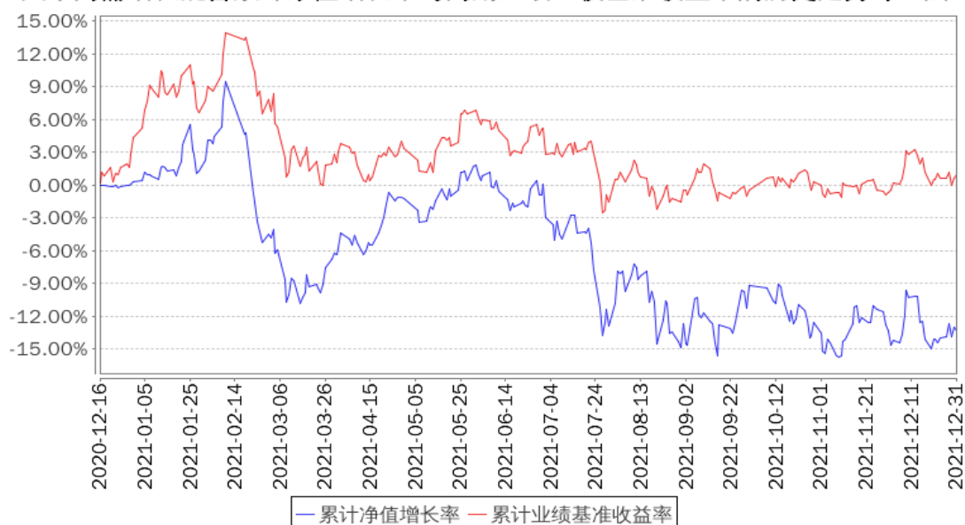
大摩内需增长混合累计净值增长率与同期业绩比较基准收益率的历史走势对比图