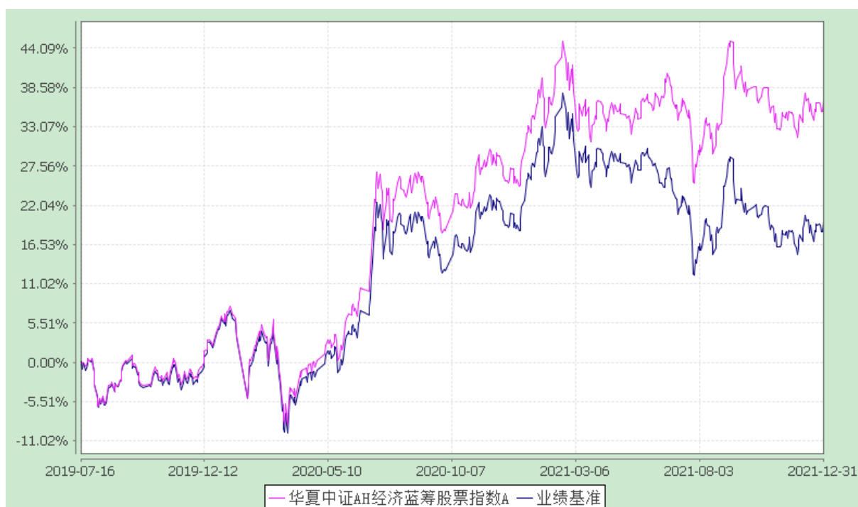
华夏中证 AH 经济蓝筹股票指数 C