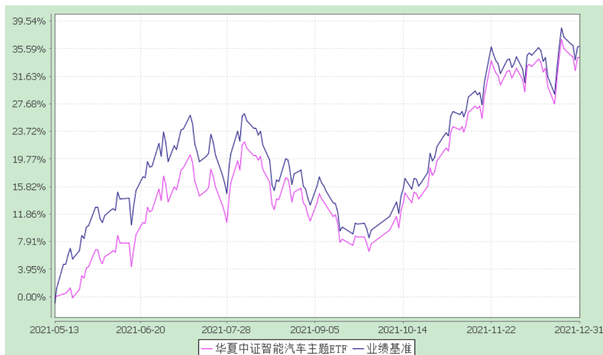
华夏中证智能汽车主题交易型开放式指数证券投资基金 份额累计净值增长率与业绩比较基准收益率的历史走势对比图 (2021 年 5 月 13 日至 2021 年 12 月 31 日)