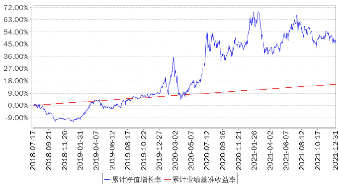
招商安益灵活配置混合累计净值增长率与同期业绩比较基准收益率的历史走势对比图