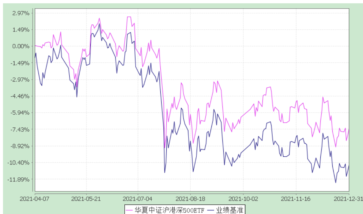
华夏中证沪港深 500 交易型开放式指数证券投资基金 份额累计净值增长率与业绩比较基准收益率的历史走势对比图 (2021 年 4 月 7 日至 2021 年 12 月 31 日)