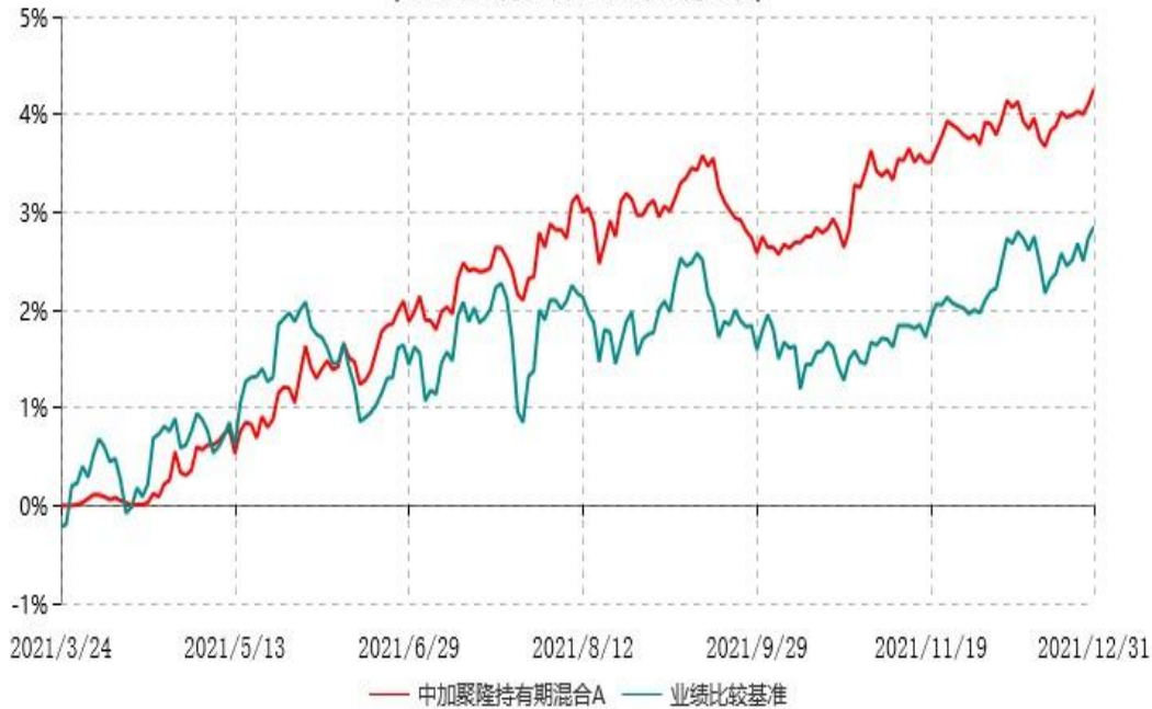
中加聚隆持有期混合A累计净值增长率与业绩比较基准收益率历史走势对比图 (2021年03月24日-2021年12月31日)