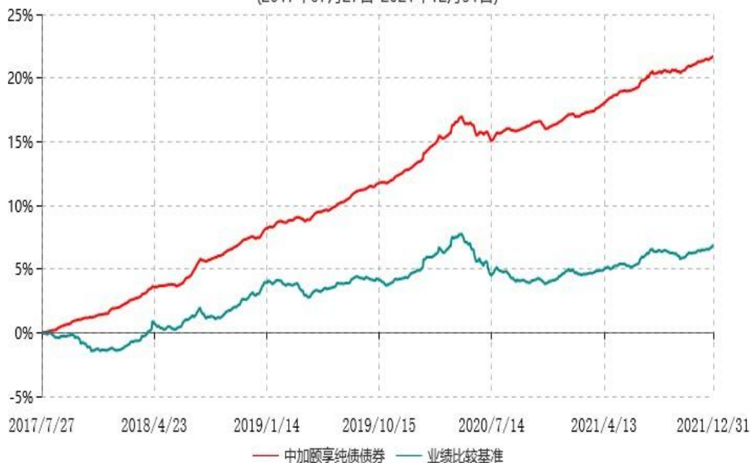
中加颐享纯债债券型证券投资基金累计净值增长率与业绩比较基准收益率历史走势对比图 (2017年07月27日-2021年12月31日)